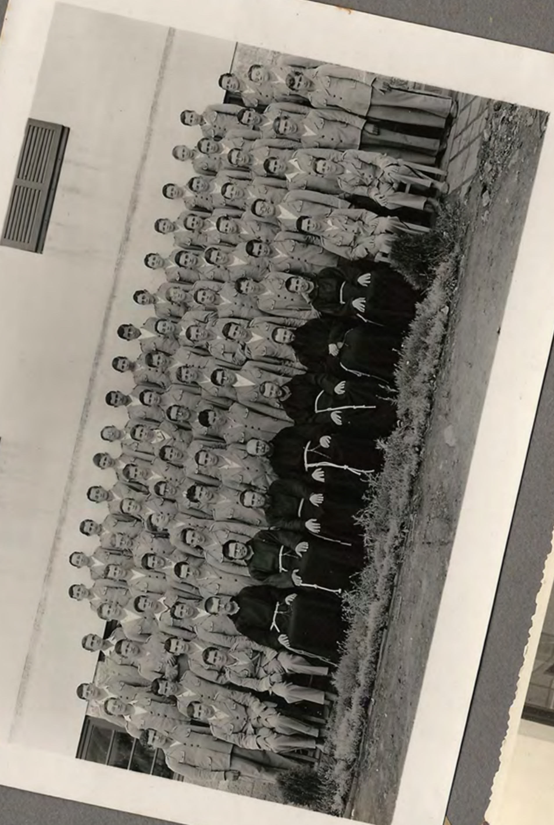
Fotografia das seminaristas em 1952