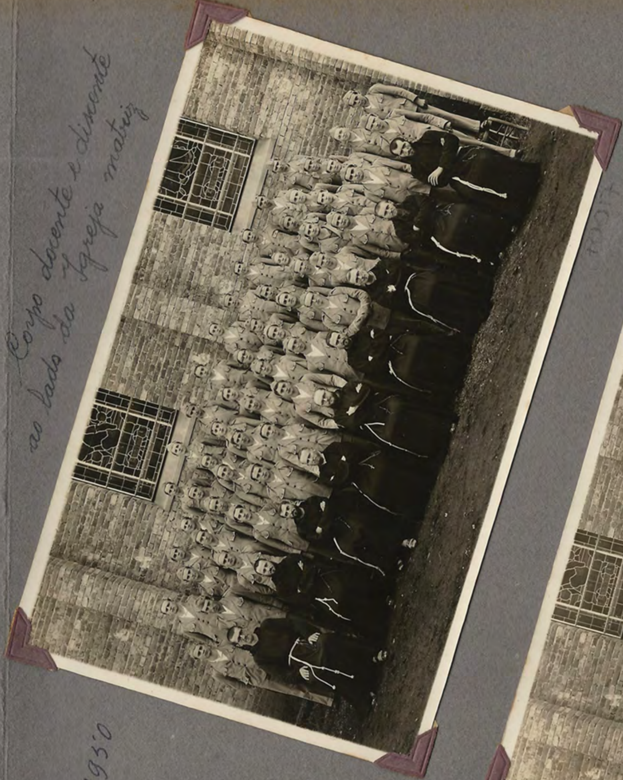
Corpo docente e discente ao lado da Igreja matriz