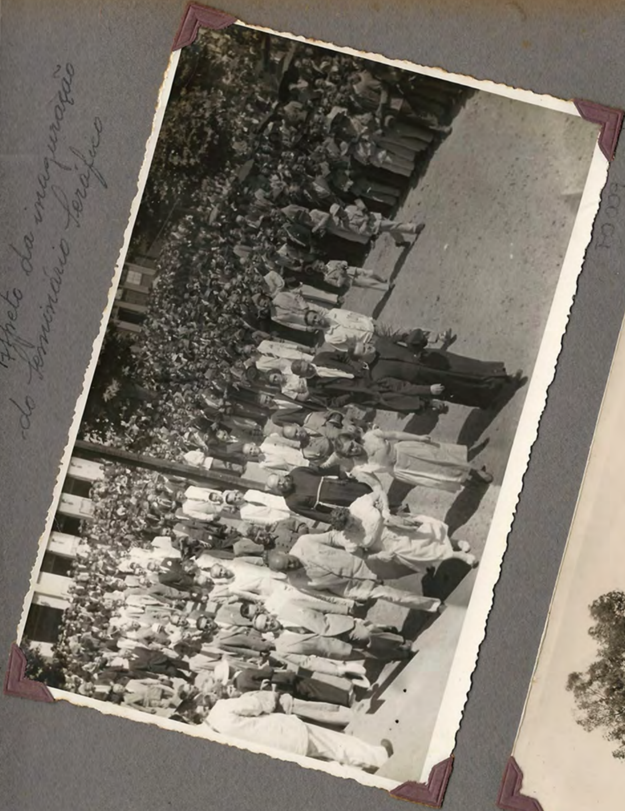
Aspecto da inauguração do Seminário Terapêutico