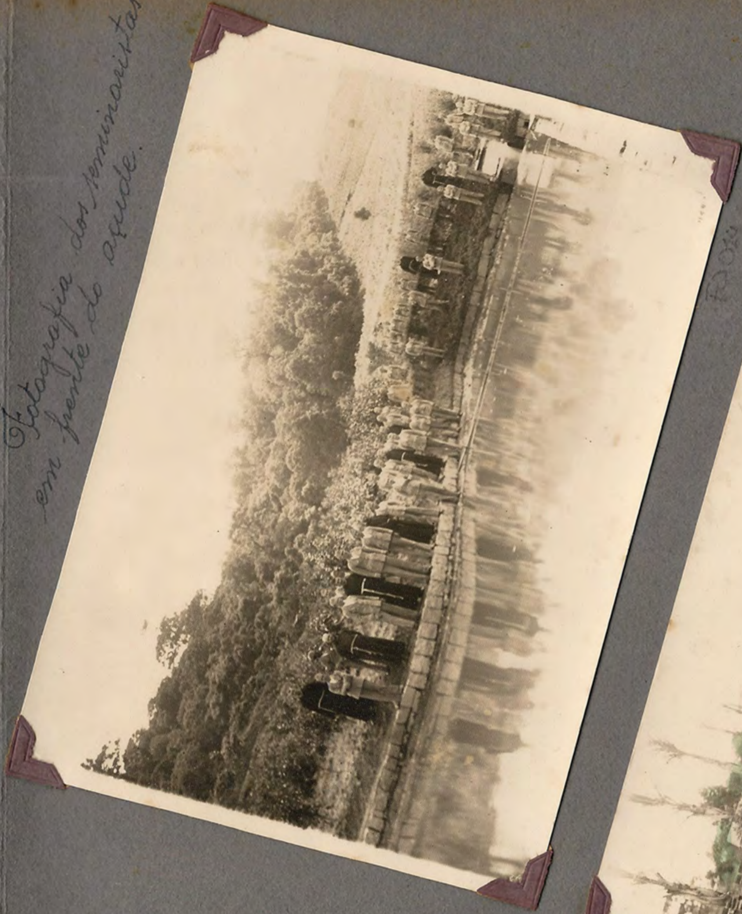
Fotografia dos seminaristas em frente do aqued.