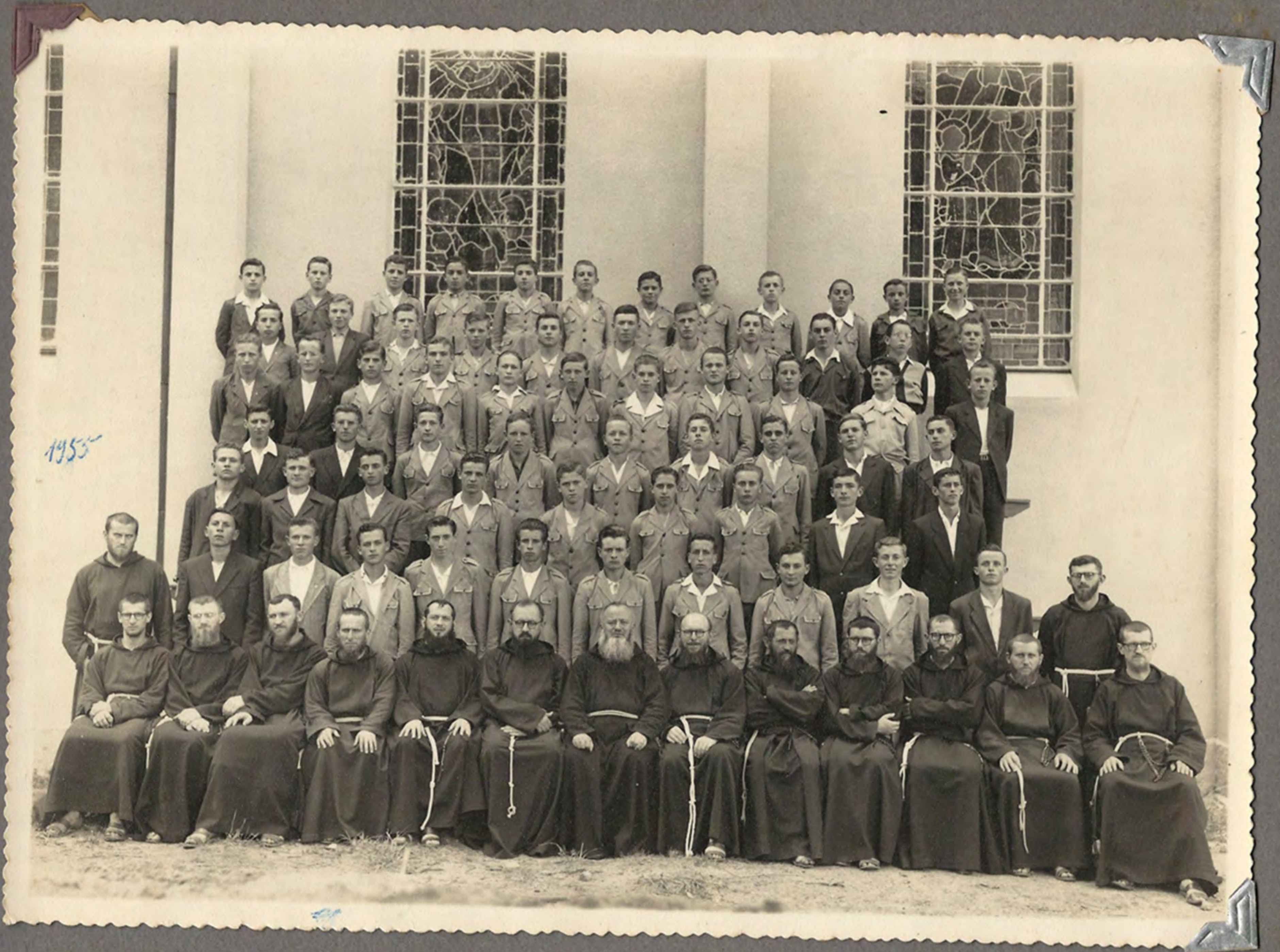
Uma das primeiras turmas que fez o tiro de guerra