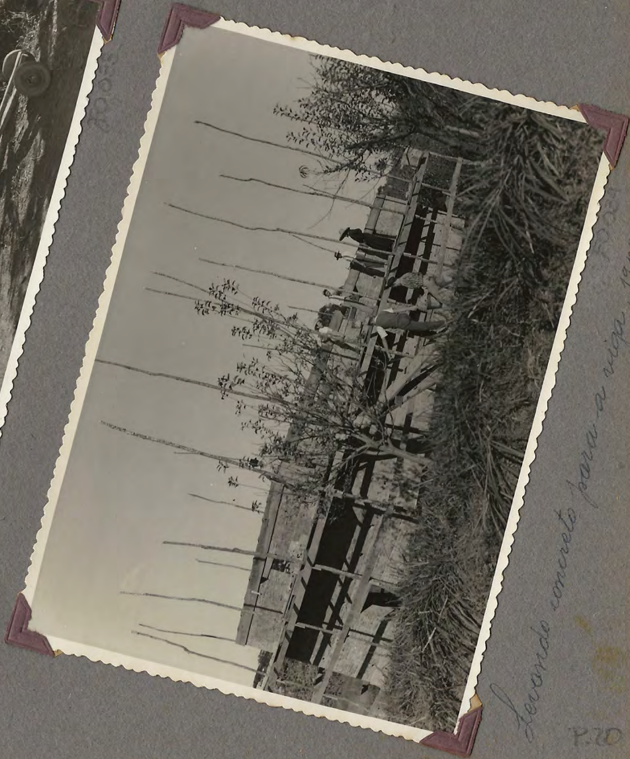
Levando concreto para a vigas, 1954