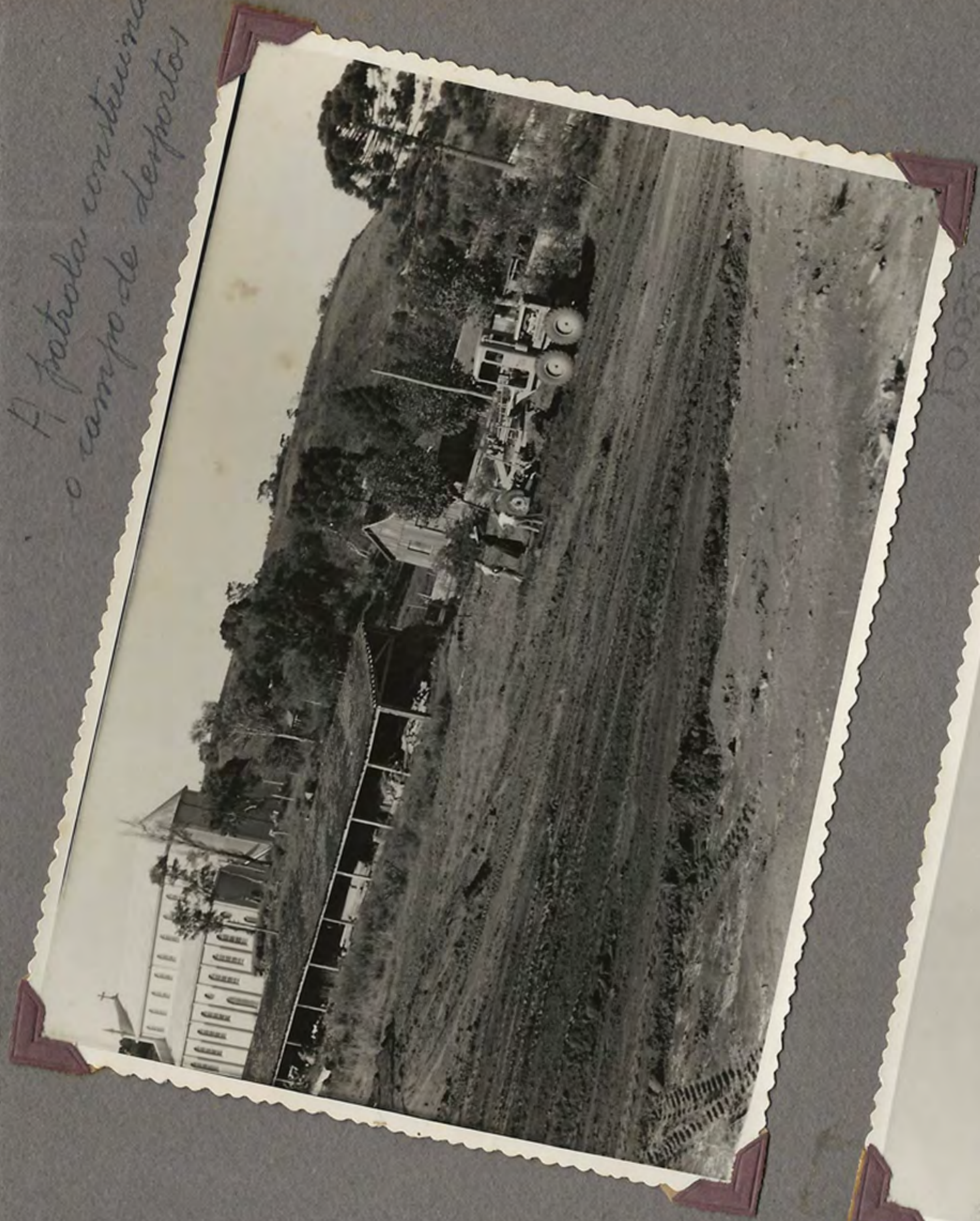
A patrôla construindo o campo de desportos