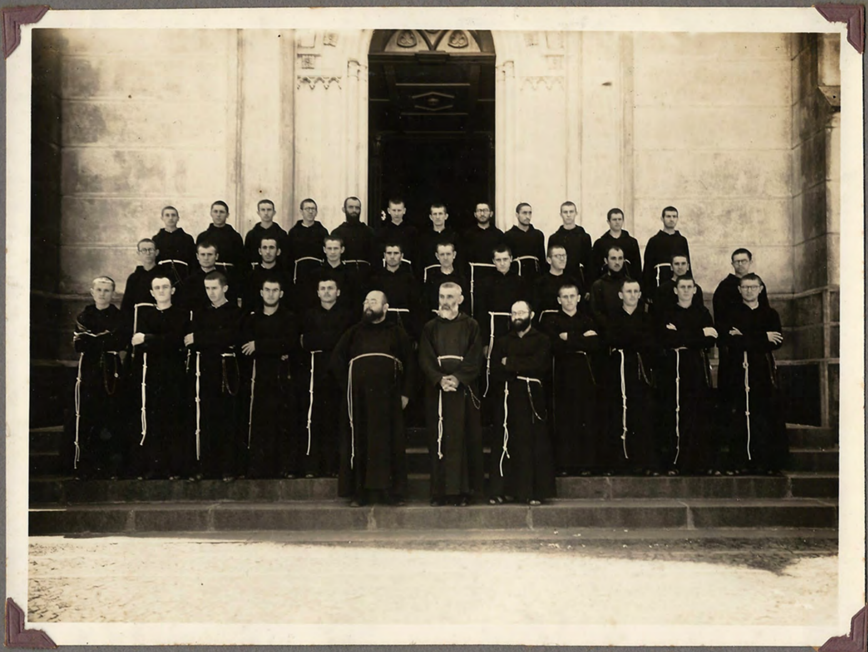
Os primeiros seminaristas de F0019 Espé ao chegarem em o noviciado, S. da Cunha