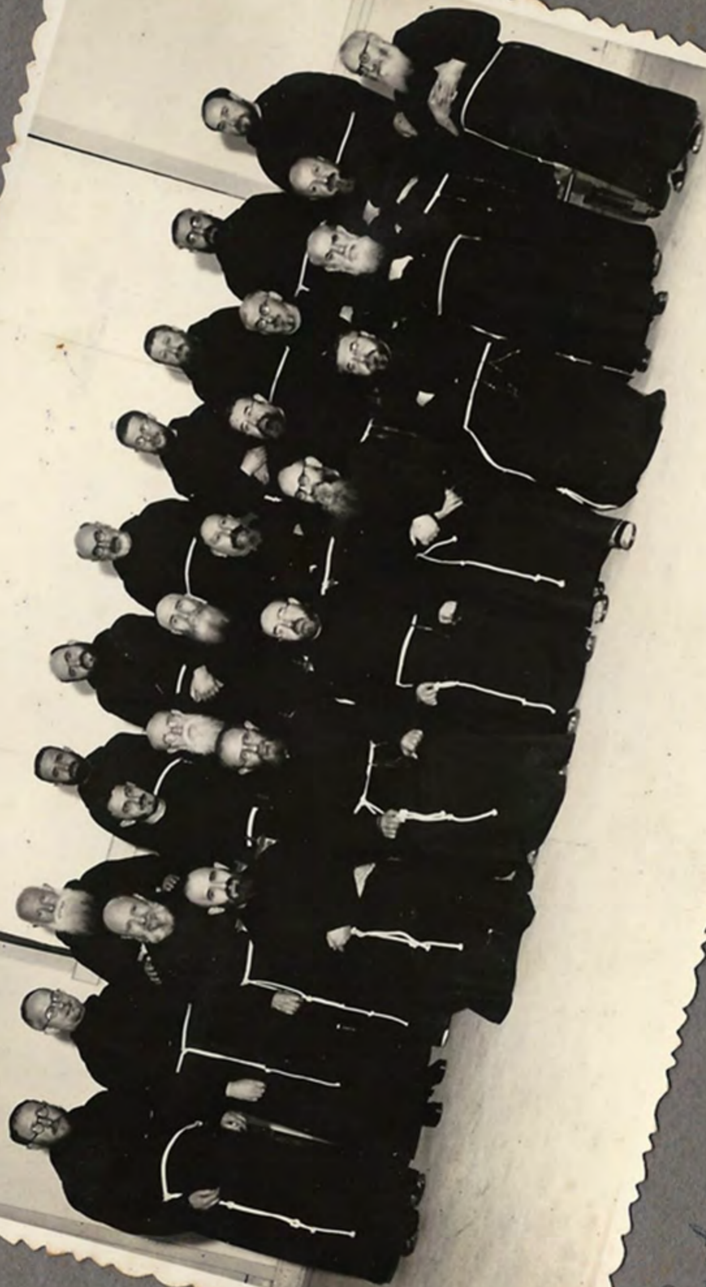
Custódia geral do Equador e Colombia