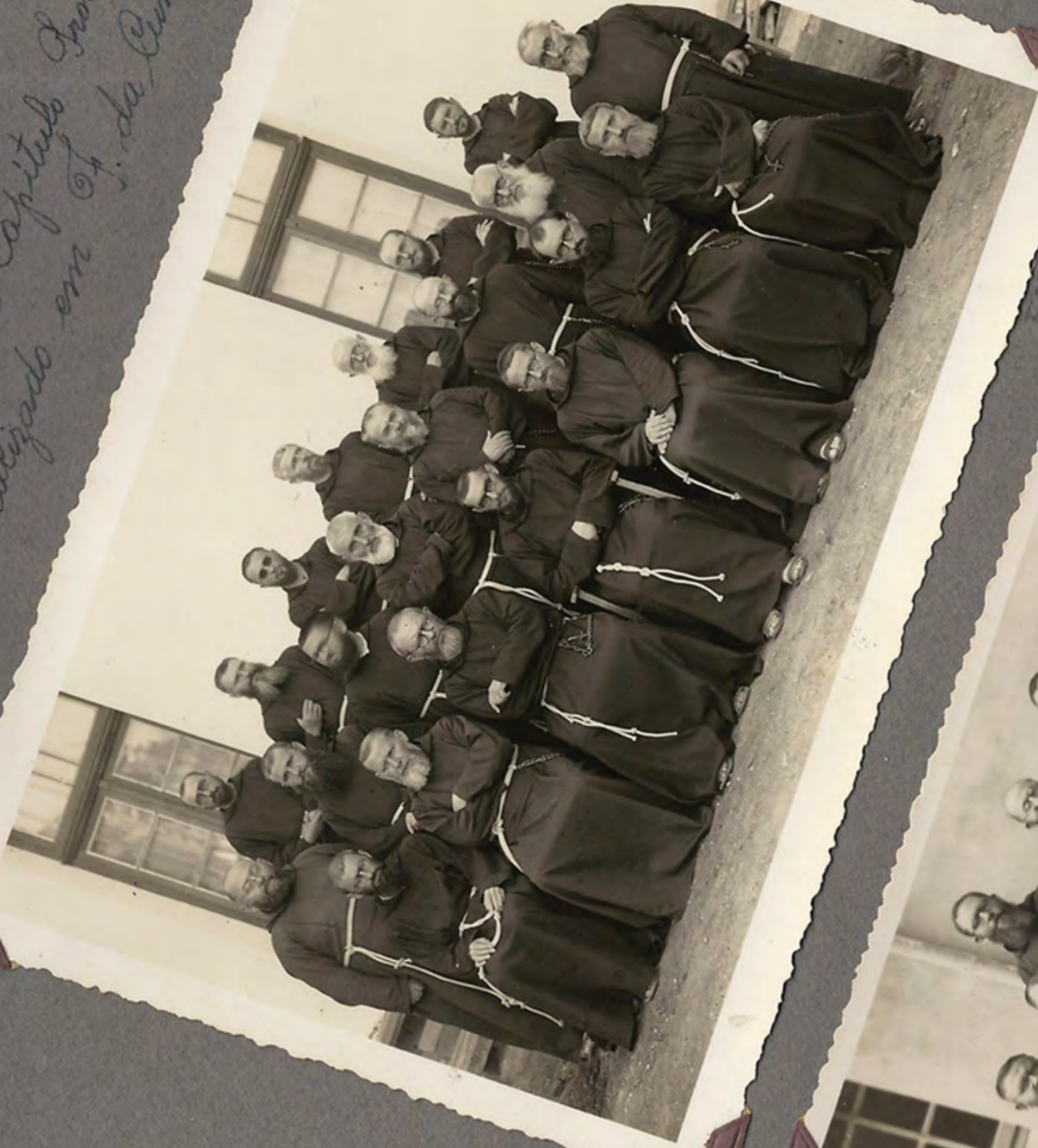
C 1.º Capítulo Provincial. realizado em F. da Cunha.