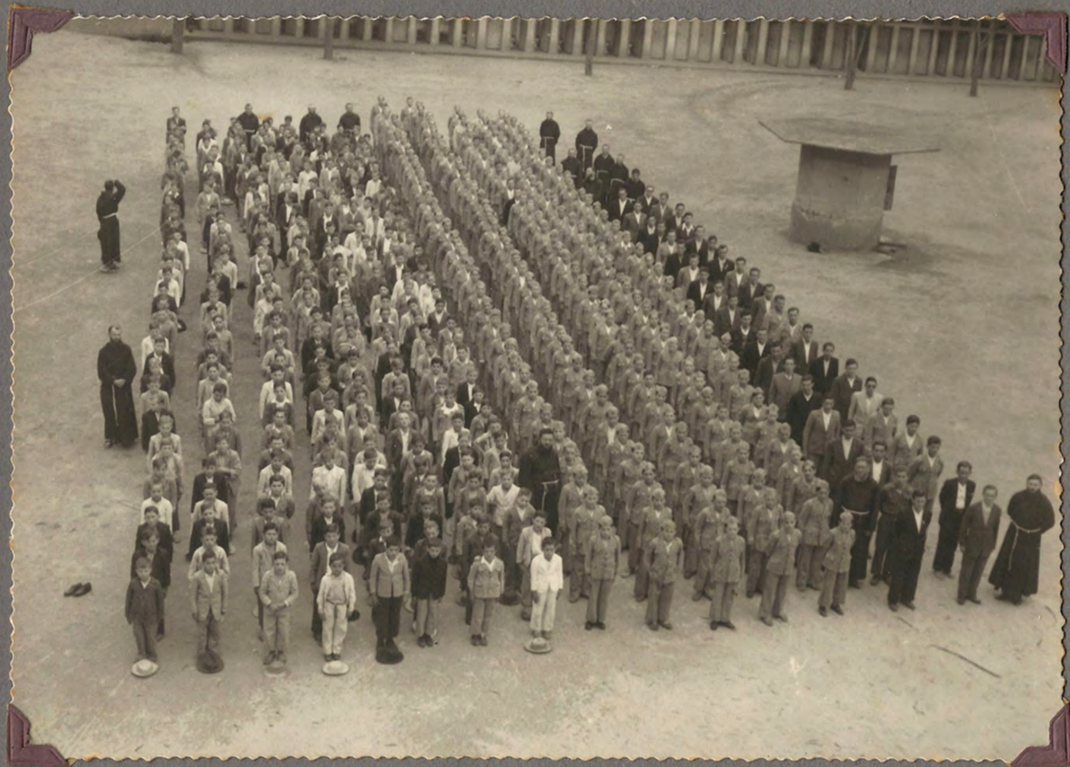
Concentração dos Seminários, Vila Flores, Veranópolis, Vila Ipe. na cidade de Veranópolis 1959