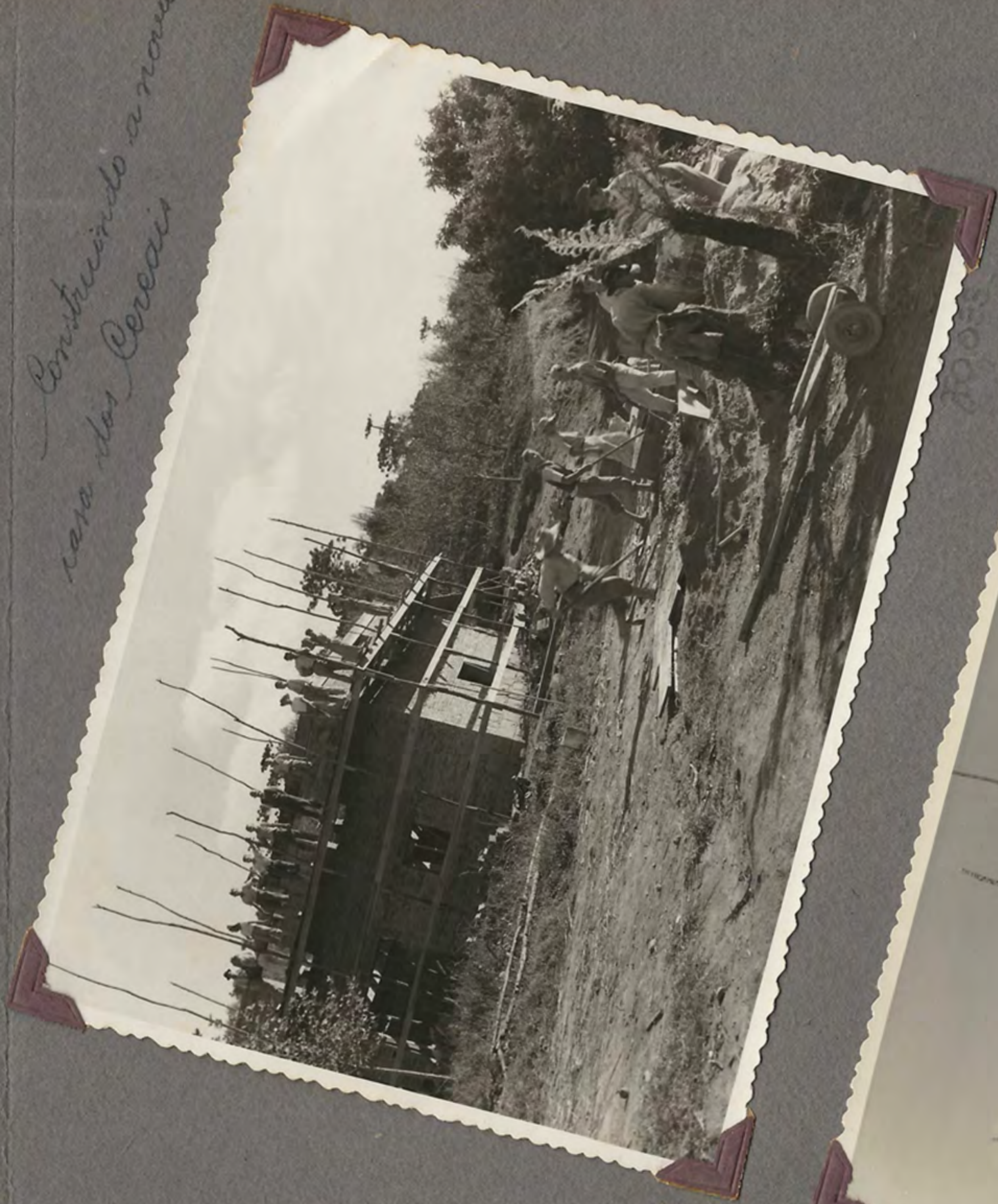
Construindo a nova casa das Cereais