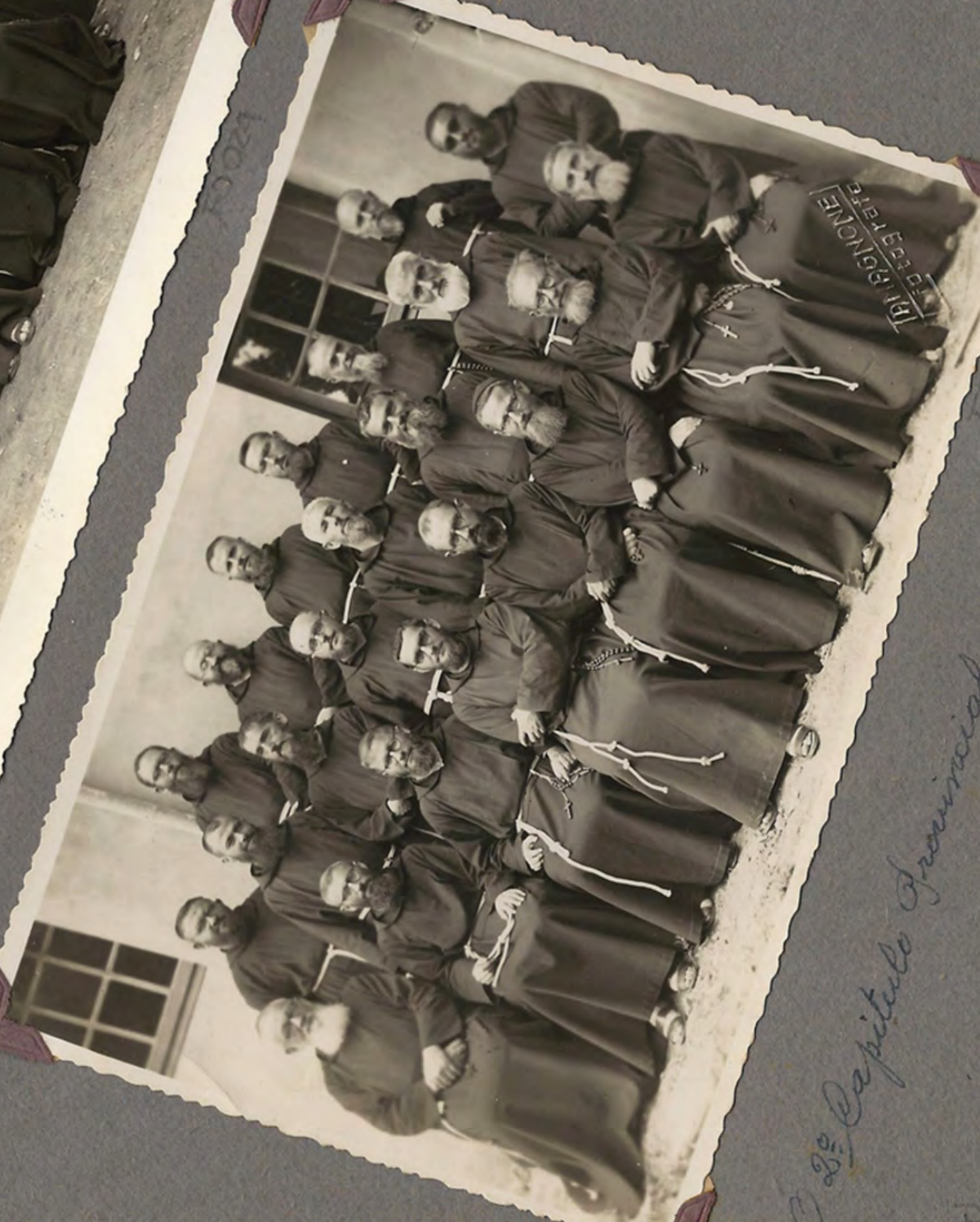
C 2.º Capítulo Provincial