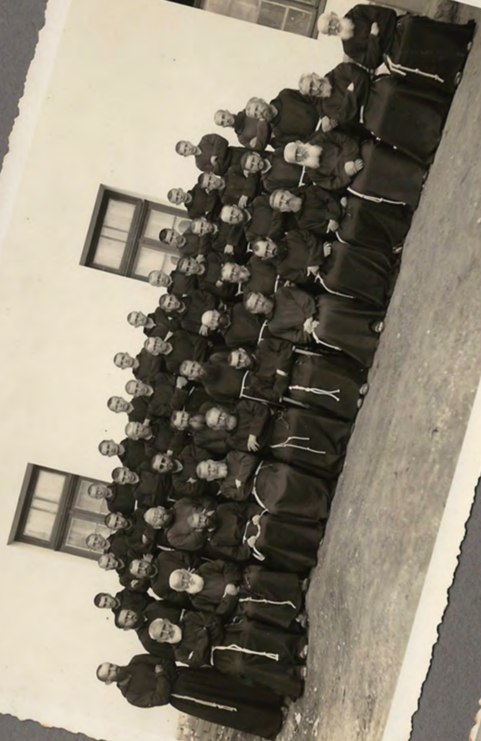
O 1.º Capitulo Provincial realizado em S. da Cunha