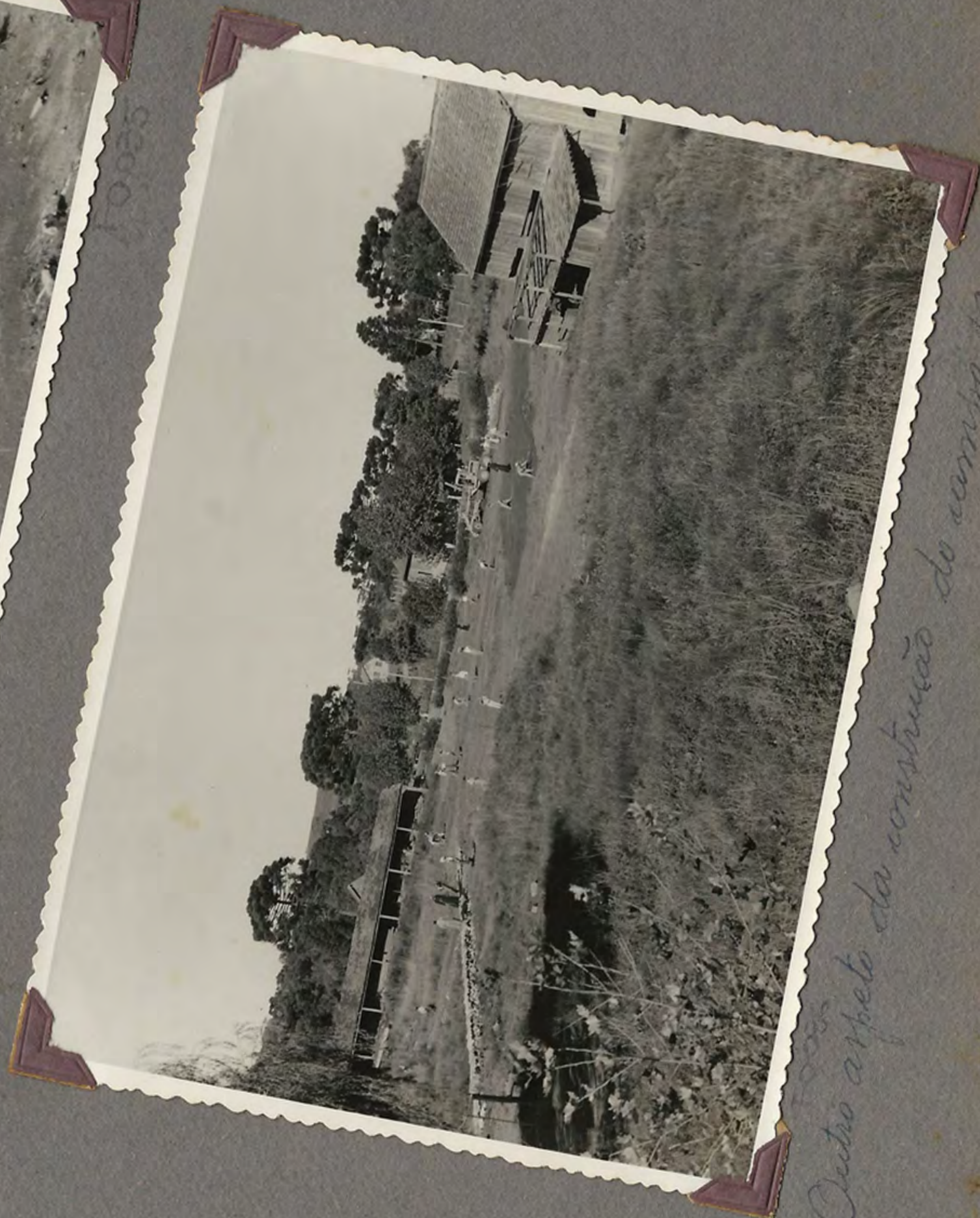
Outro aspeto da construção do campo. 1954