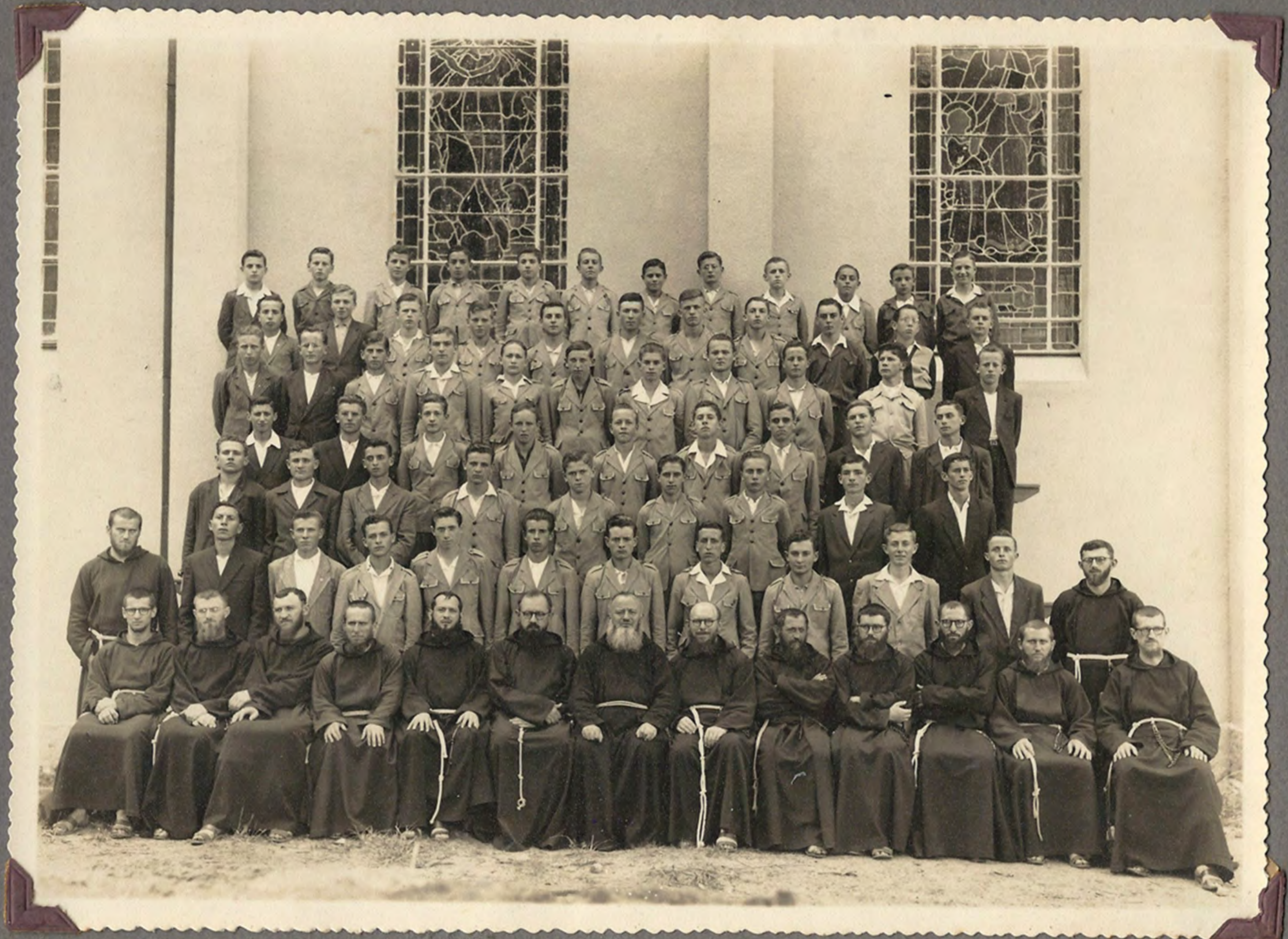
FO 031 Os seminaristas por ocasião da visita do Rev. mo P. e Geral. 1954