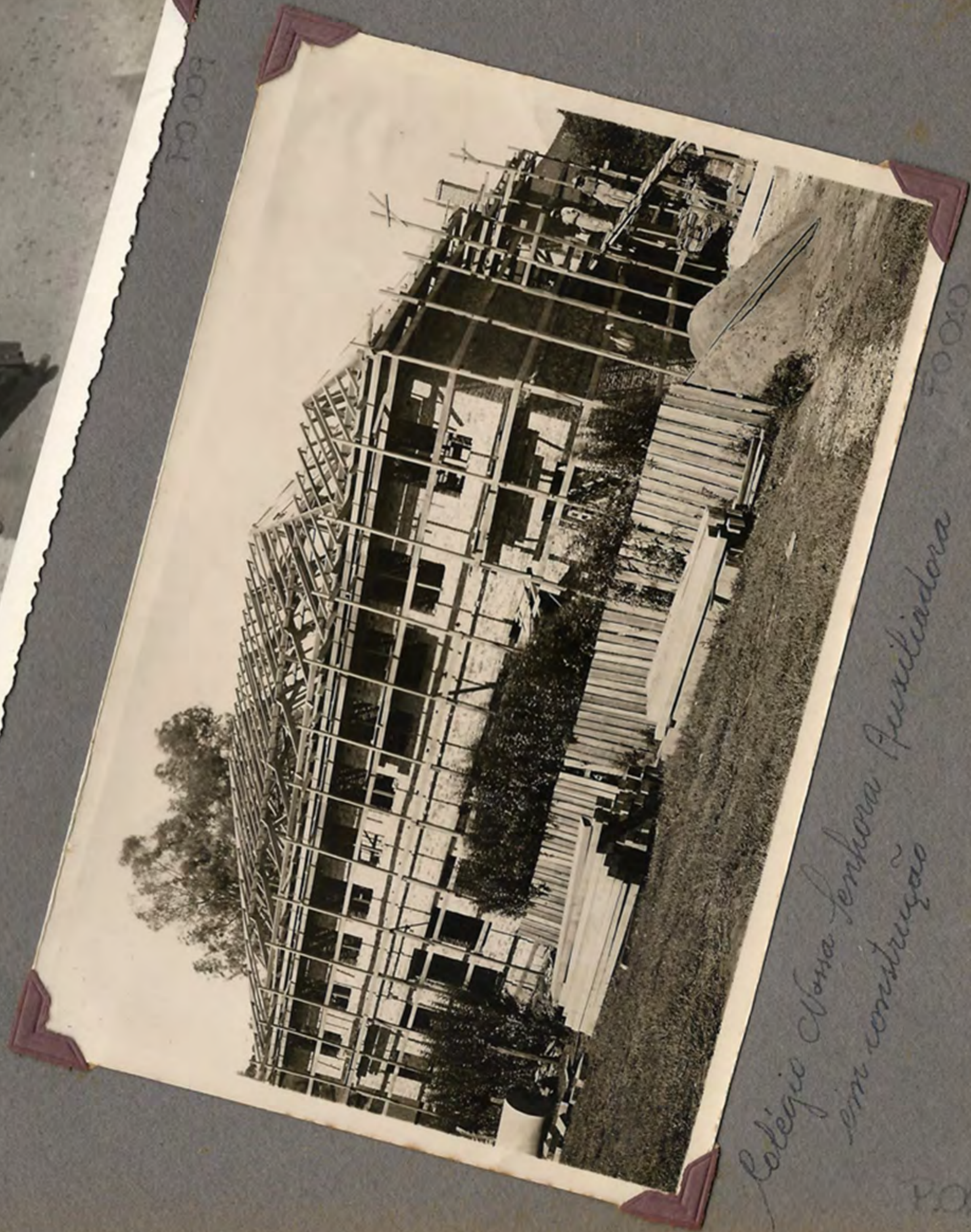
Colégio Nossa Senhora Auxiliadora em construção