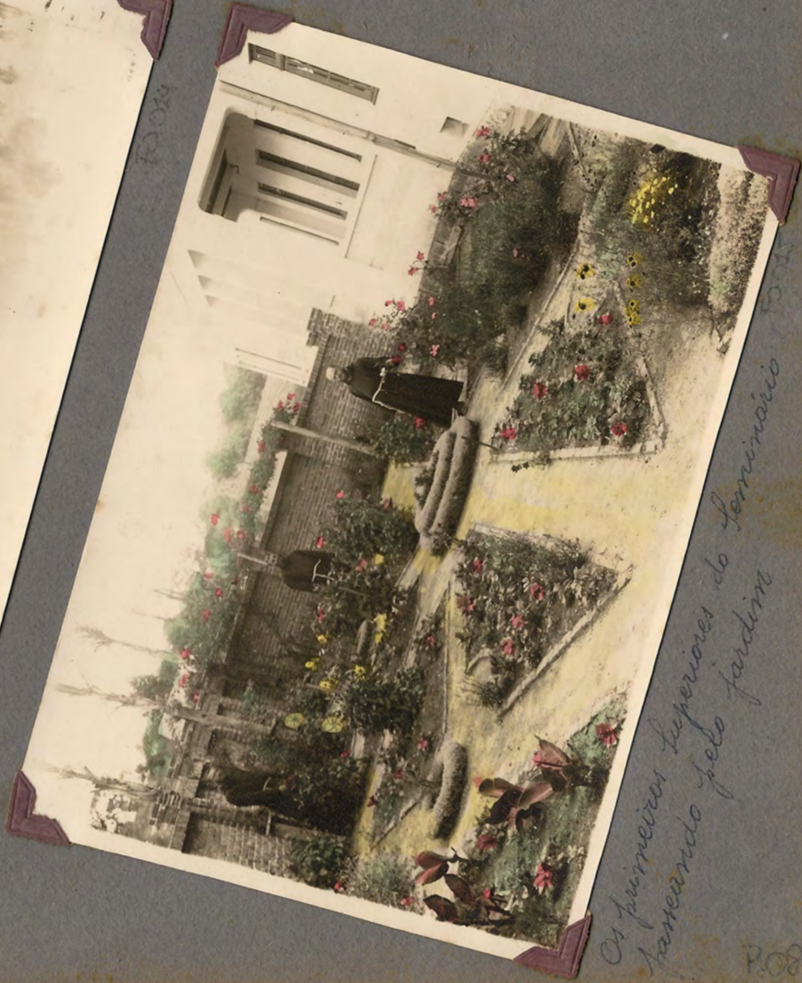
Os primeiras Superiores do Seminário trabalhando pelo jardim