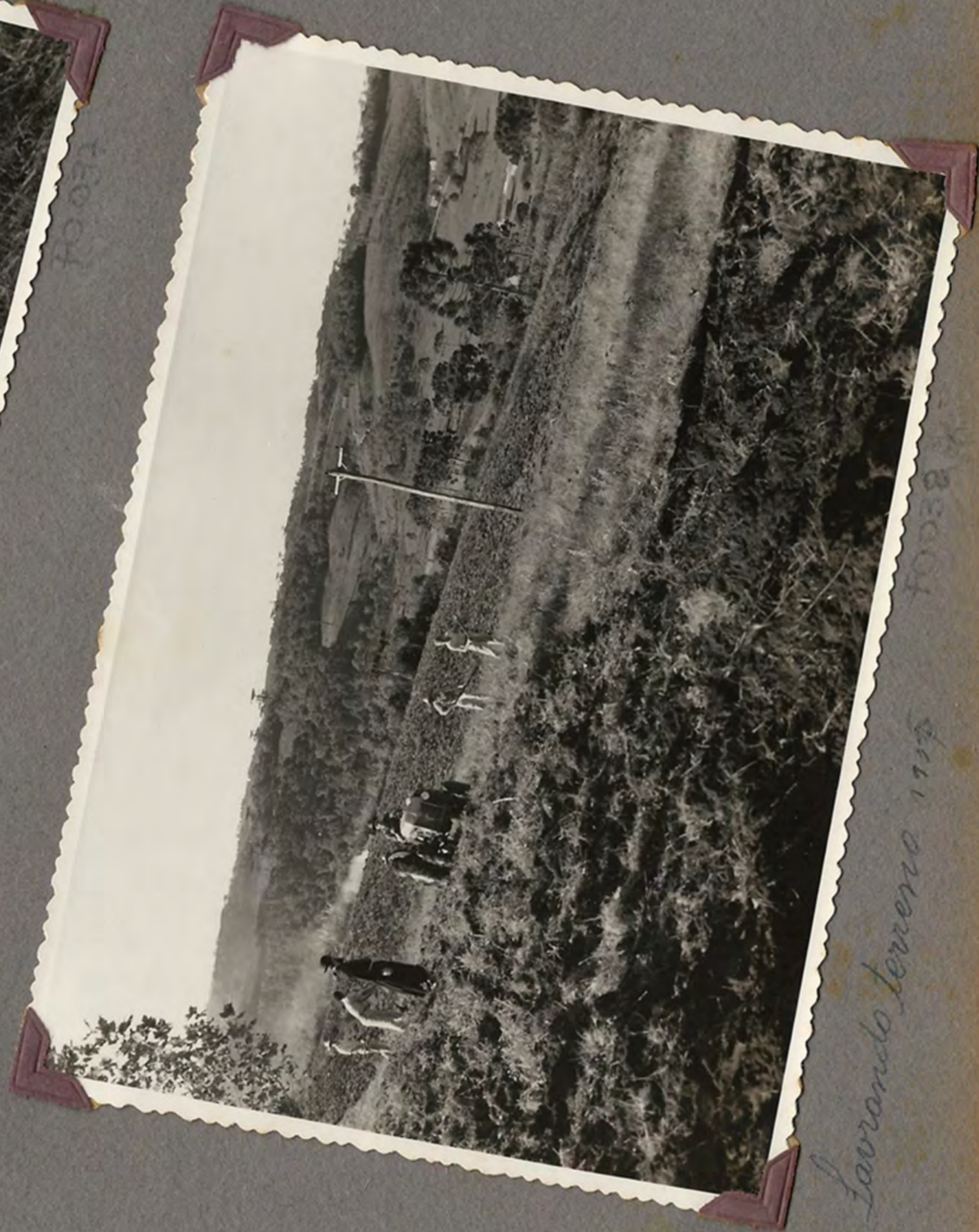
Lavrando terreno 1954