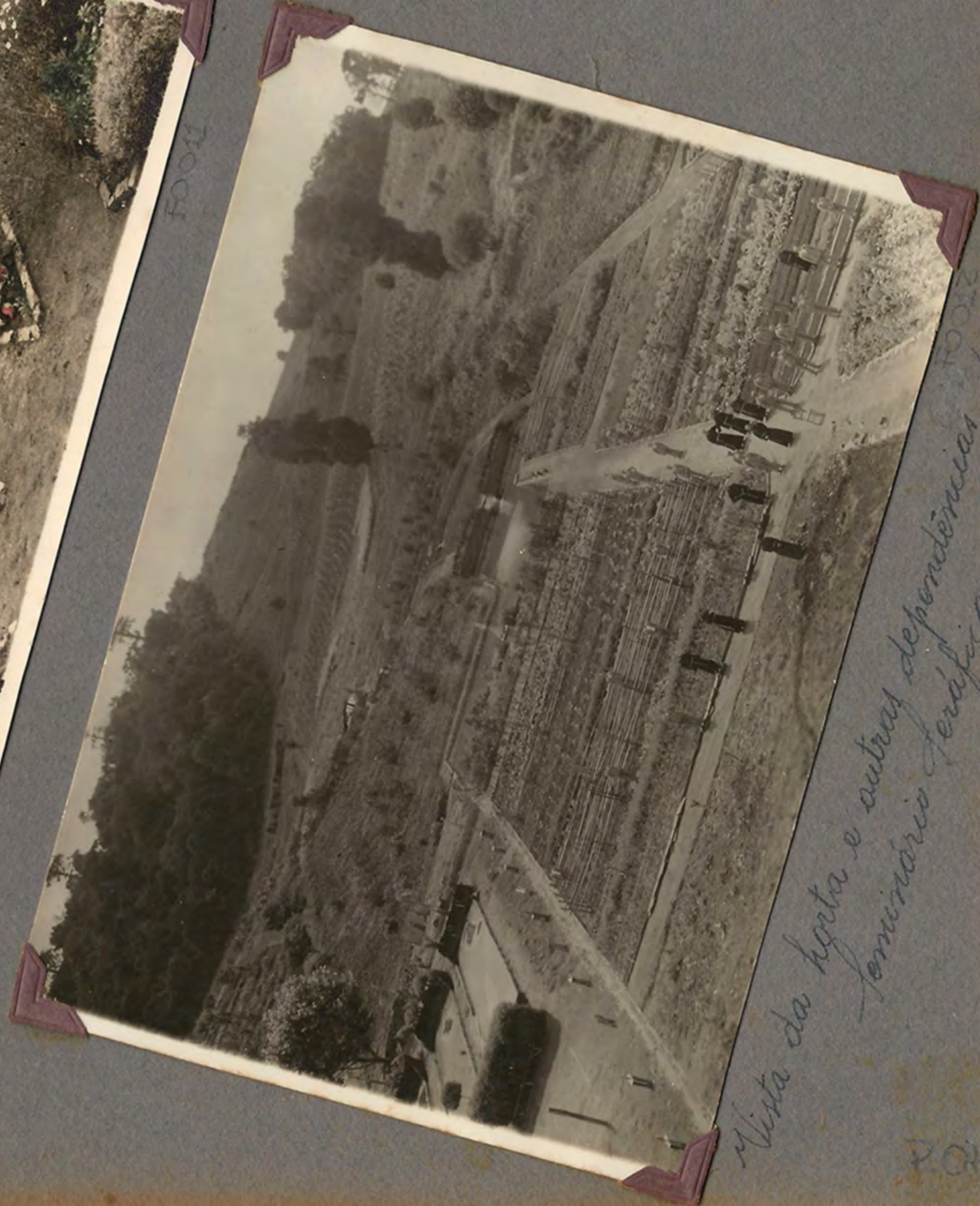
Visita da horta e outras dependências do Seminário Paróquial