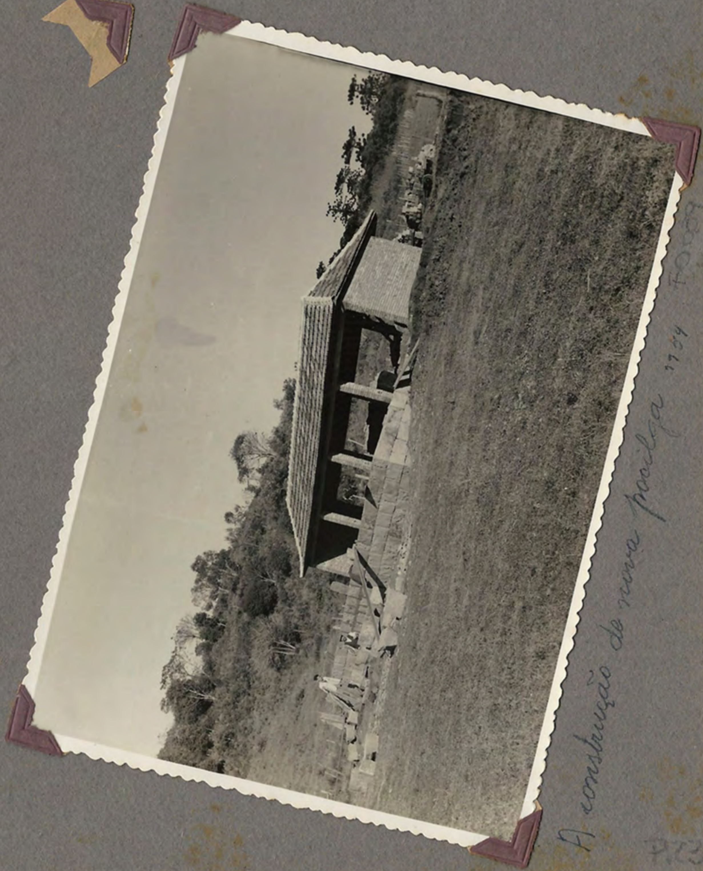
A construção de nova escola 1954 Foto

Aspecto do Seminário da Igreja matriz 1954