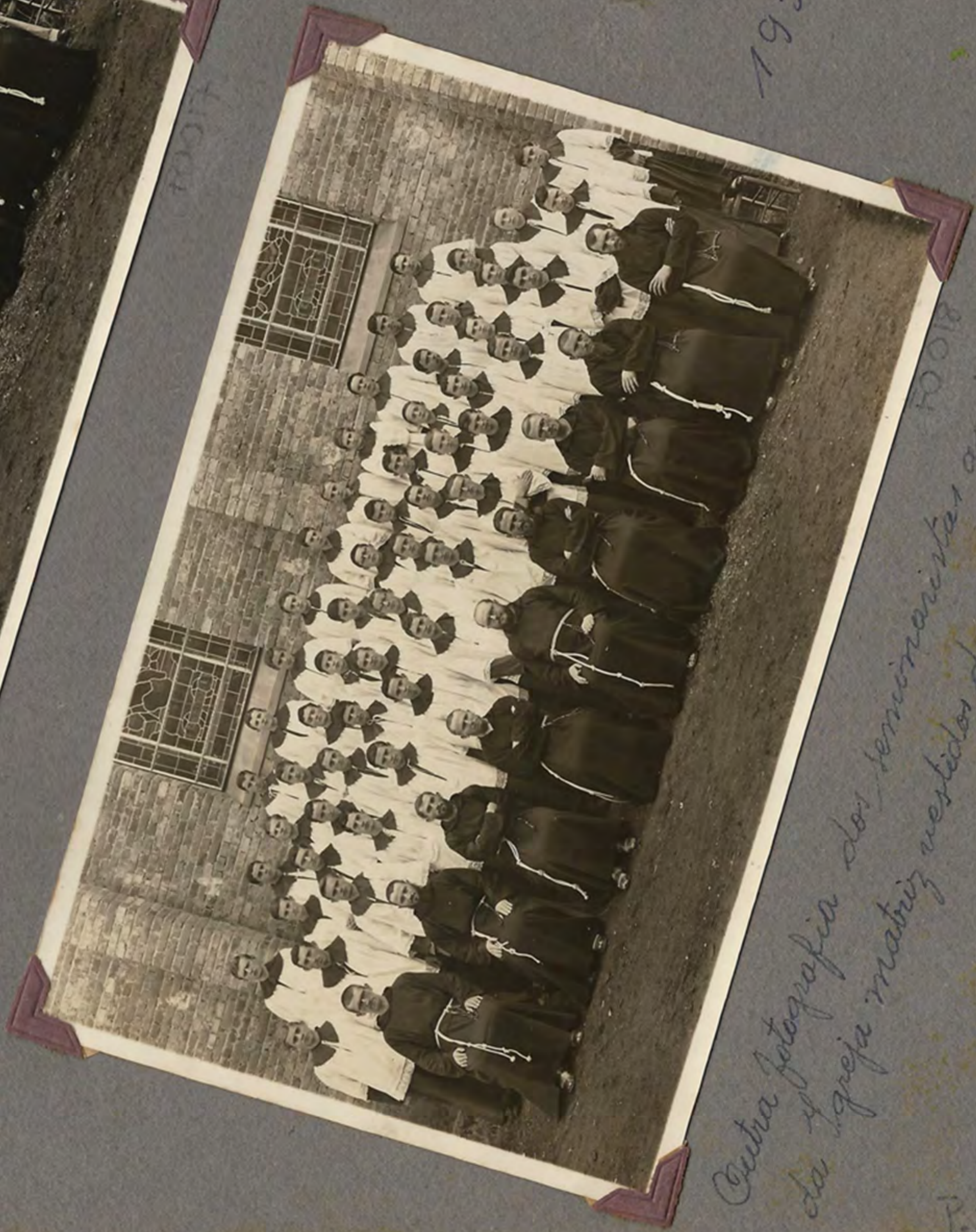
Outra fotografia dos seminaristas ao lado da Igreja matriz vestidos de corcinhas