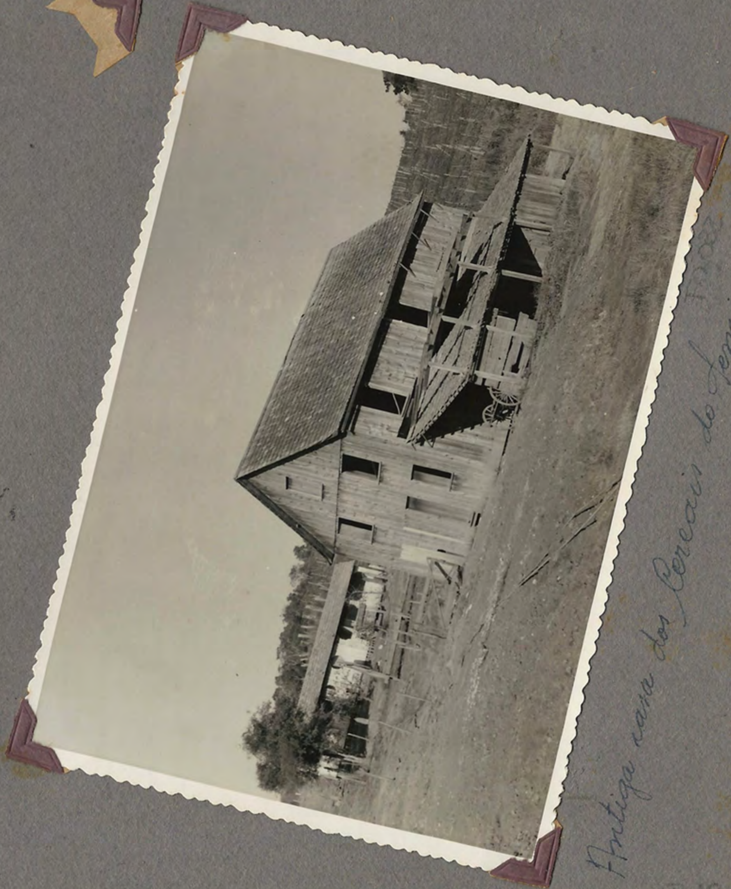
Antiga casa dos Coreanos do Seminário