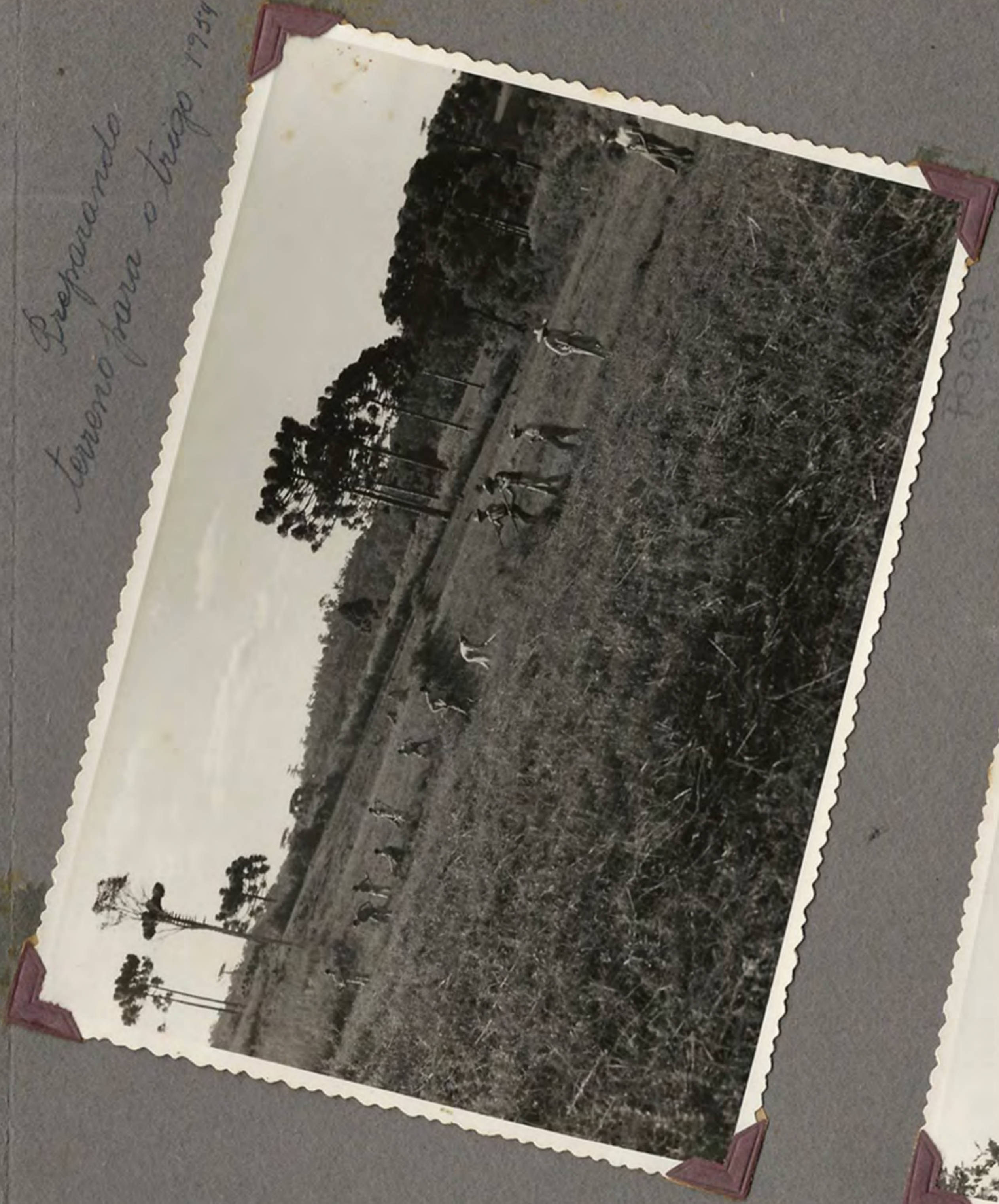
Preparando terreno para o trigo 1954