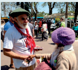
29ª Romaria Maria, mãe do Redentor, Cachoeira do Sul

Sensibilizar os cristãos para a realidade da epidemia da Aids nas Romarias das dioceses é um compromisso assumido pela Casa Fonte Colombo e Pastoral da Aids do RS desde 2002.