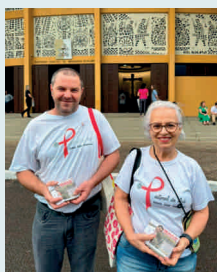
80ª Romaria da Medianeira, em Santa Maria