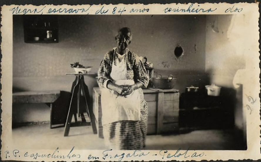
P. P. caquelinhas em Fragata - Pelotas.