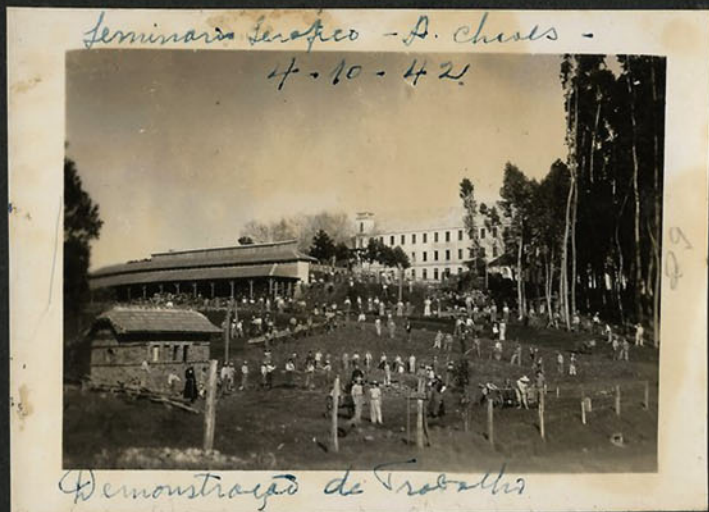
Demonstração de Trabalho