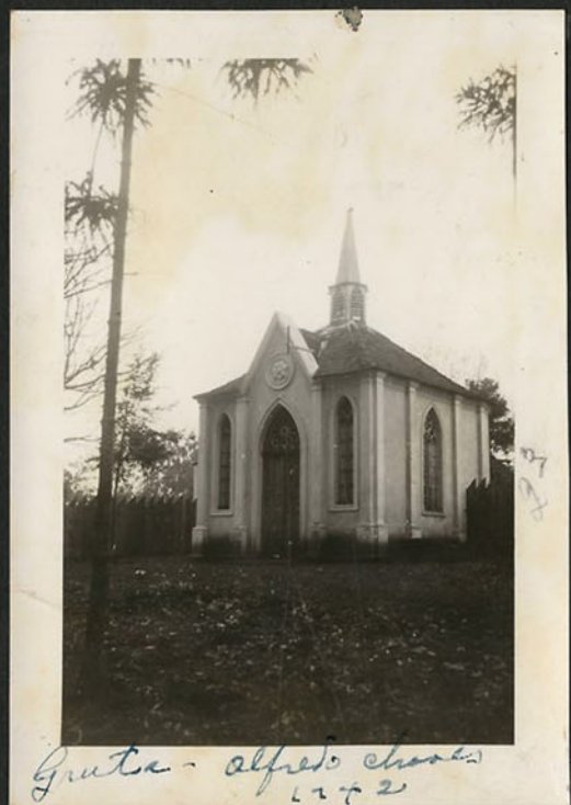
Gruta - Alfredo Chaves 12/2