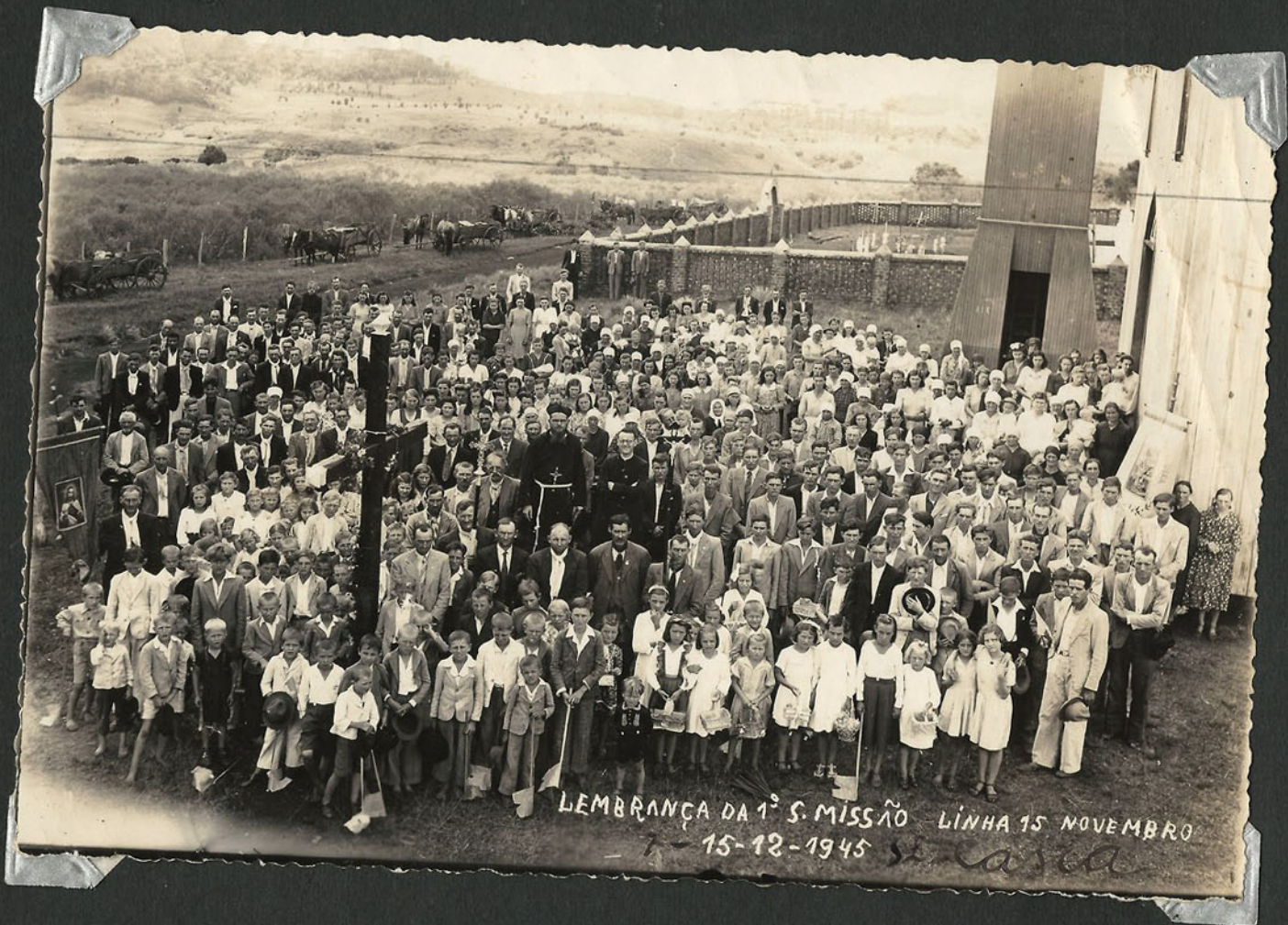
LEMBRANÇA DA 1ª S. MISSÃO LINHA 15 NOVEMBRO 15-12-1945