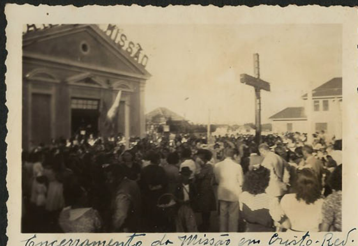
Encerramento da Missão em Cristo-Red.