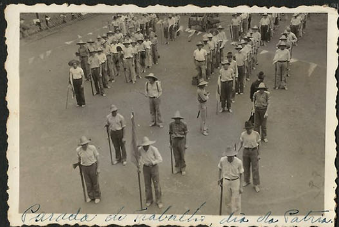
Parada do Trabalho, dia da Pátria