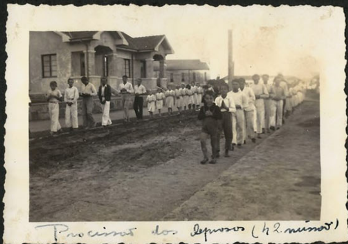
Procurados dos leprosários (42 minutos)