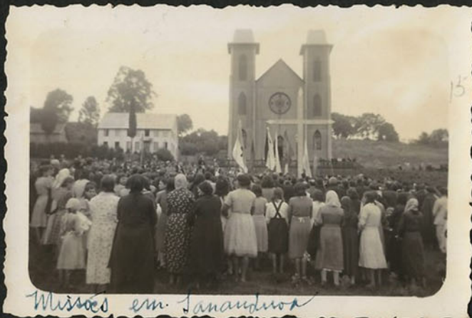
Missões em Sananduaçu