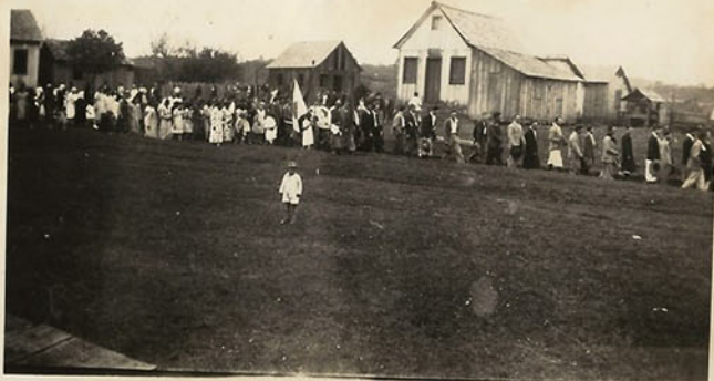
Dois aspectos duma procissão na colônia caseiras S. Ver.