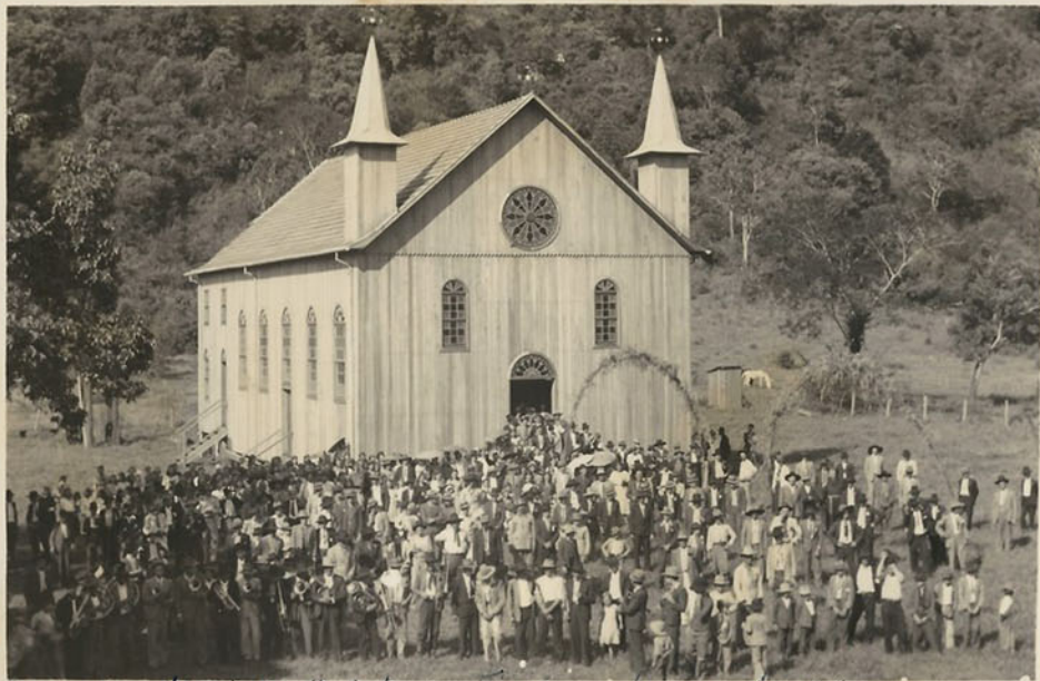
Encerramento Missões St. Antonio - Foz de - Sananduaçu