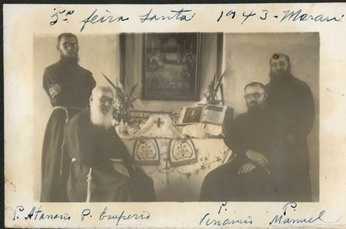
3.ª feira Santa 1943 - Maracá