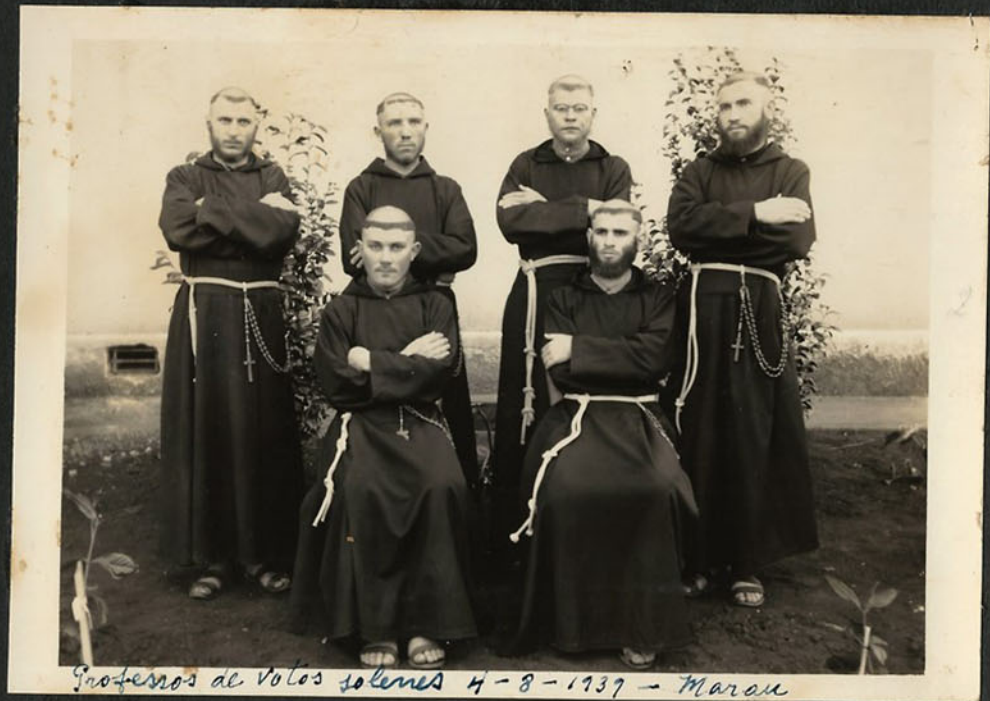
Professos de Votos solenes 4-8-1937 - Maranh