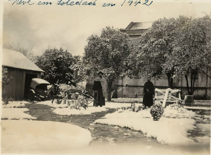
Neve em Soledade em 1942