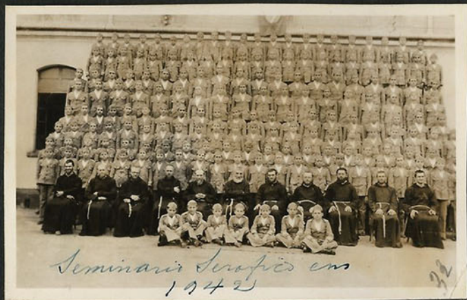
Seminário Seráfico em 1942