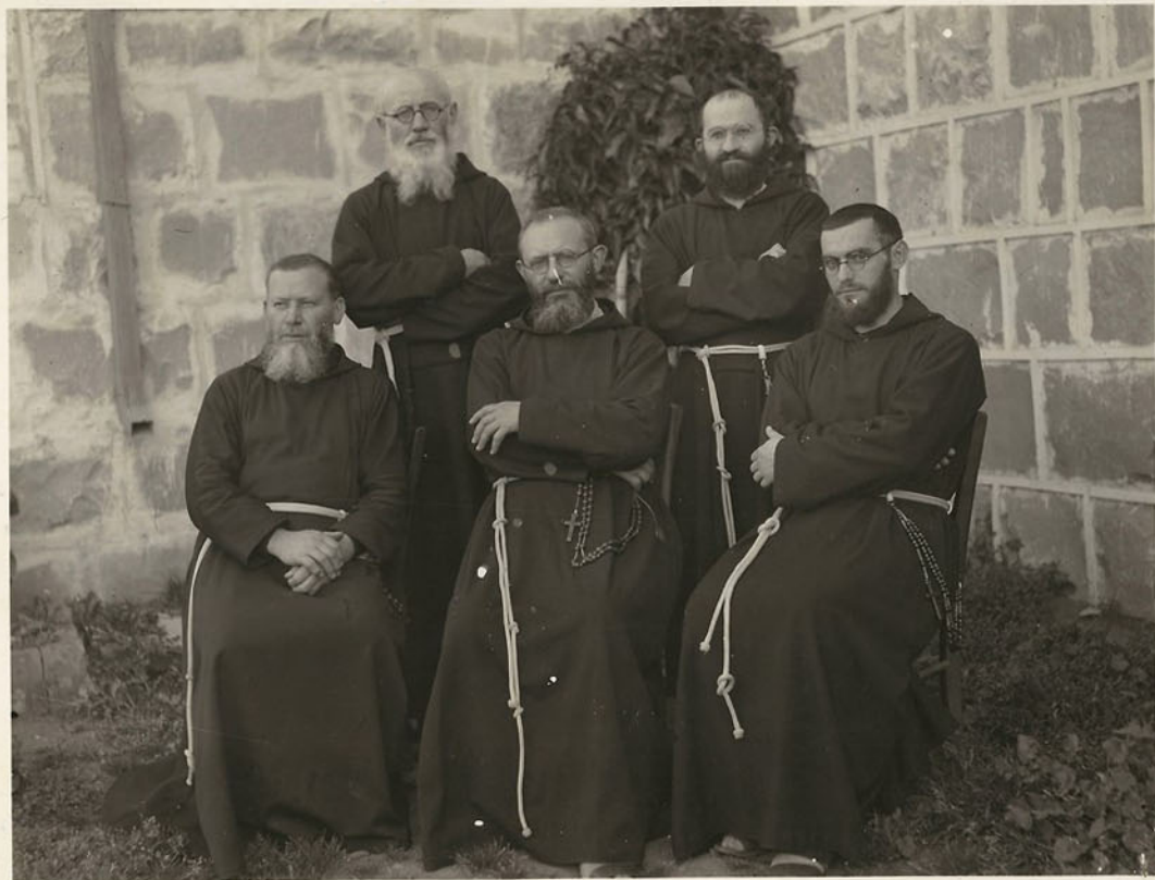
70070 Primeiro Definitório Provincial - 1942