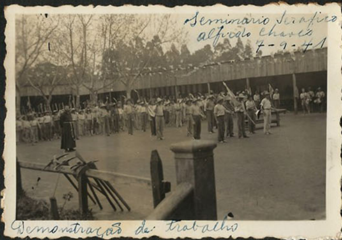
Demonstração de trabalho