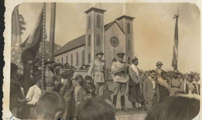
Semana da Pátria em Sananduaçu