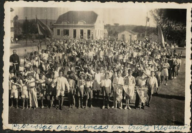
Processão das crianças em Cristo Redentor.