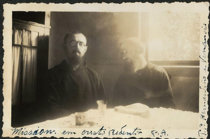
Mission. em Cristo Redentor P.A.