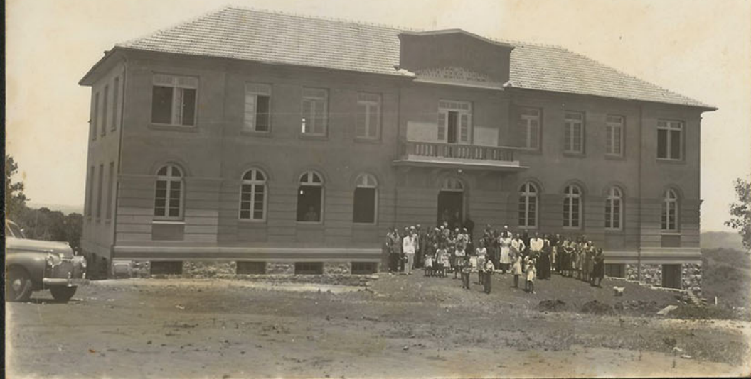
Inauguração do Hospital, construído pelo F. Clemente Cap., em Soledade 7-1-1942