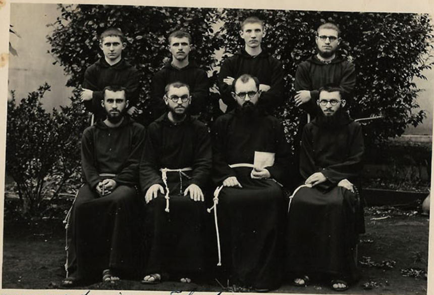
Curso que terminou a Filosofia em 1944