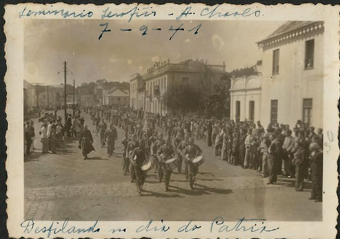
Desfilando no dia do Patria