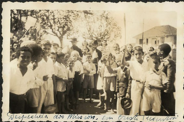
Despedida das Missões em Cristo Redentor.